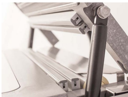
Lama taglia pellicola