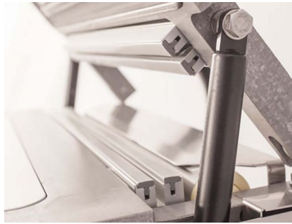
Schneidmesser für Folie