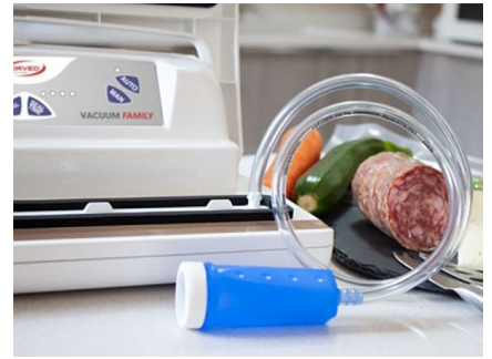
Paja de aspiración