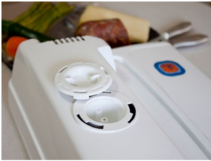
Tecnología del futuro