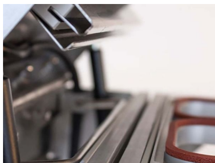
Hoja de corte de película