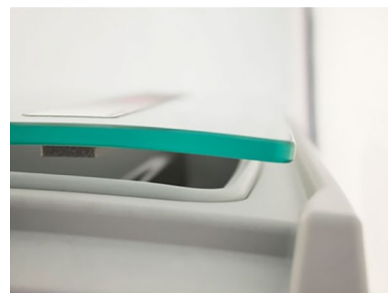
Design italien moderne