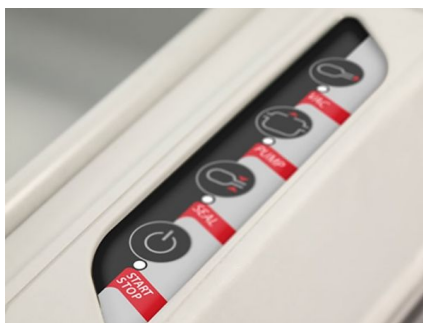
Panneau de commandes tactile