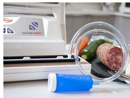
Paja de aspiración