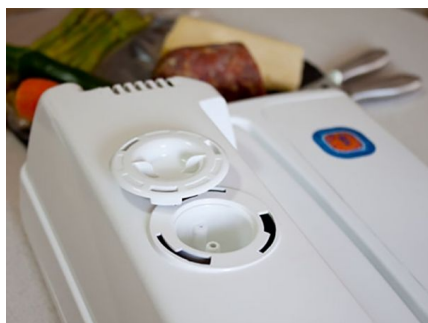
Tecnología del futuro