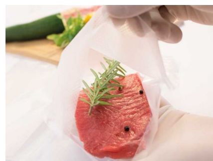
Vakuum - Gas