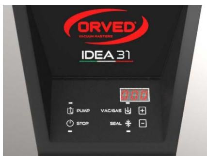
Panneau de commandes numérique