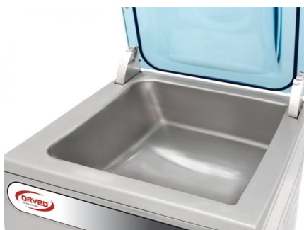
Camera a vuoto