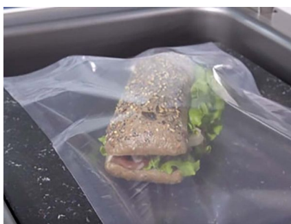
VACÍO CON GAS (OPCIONAL)