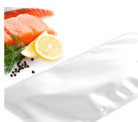
Idonei al contatto alimentare