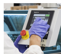
Sistema di gestione qualità delle buste certificato ISO9001