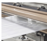
Film provenienti da estrusore "a testa piana"