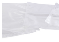
Utilizzo di polimeri non riciclati