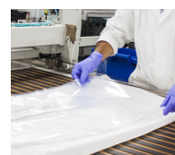
Rotoli sottovuoto sempre controllati e certificati