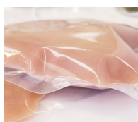
Mantenimento del vuoto nel tempo grazie alla costanza di spessore