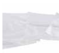
Uso de polímeros no reciclados