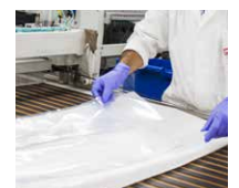
Stets kontrollierte und zertifizierte Vakuumbeutel.