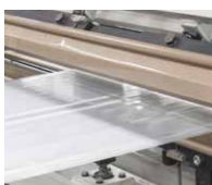
Im Flachfolienextruder hergestellte Folie.

MIN: 3°C / MAX: 85°C-72h/100°C-2h/121°C-30'