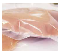
Beibehaltung des Vakuums dank durchgehender Stärke.