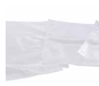
Verwendung von nicht recyclten Polymeren.