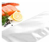
Geeignet für den Kontakt mit Lebensmitteln.