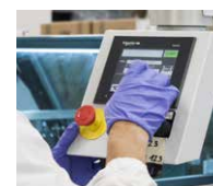
Nach ISO9001 zertifiziertes Qualitätsmanagementsystem.